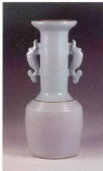
湿故知新 龍耳花生